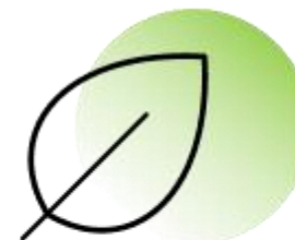
Земельный участок под ИЖС