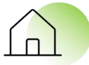
Дом с земельным участком