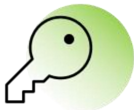
Квартира в новостройке